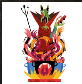
2023 SENSE FUM! Àgata Gil